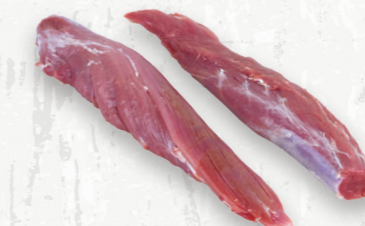
Filet de porc

La longe d'épaule est considérée comme étant le rôti de porc à la saveur la plus prononcée dans de nombreux pays. Bien persillée et de texture moyenne, la viande offre une saveur riche et un résultat juteux.