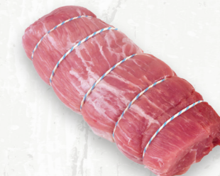
Rôti désossé de centre de fesse

Le « coeur des côtes croisées » est un rôti bien persillé à texture ferme avec une saveur prononcée.