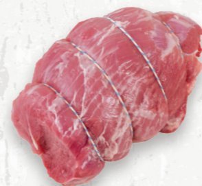
Rôti désossé de pointe de fesse

Le rôti d'extérieur de fesse au four offre une texture ferme, une saveur moyenne et une viande maigre, parfait pour de plus petits rôtis. Il se prête bien à la saumure, à la marinade liquide ou sèche et au glaçage afin de bonifier sa saveur, sa jutosité et sa tendreté.