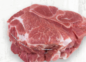
Rôti de palette de porc

Le « baron du porc » est un rôti pour le four à texture ferme et saveur délicate, parfait pour les tranches fines des sandwichs trempette.