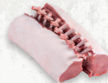
Rôti de côtes de porc, le carré

Les rôtis en filet de porc haché assaisonné offrent une variété d'options de rôtissage à prix avantageux avec de délicieux profils internationaux de saveurs.