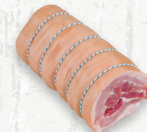
Flanc de porc, rôti de flanc de porc

Le rôti « armoiries » est parfait pour les occasions spéciales en famille et entre amis. Cette combinaison de bout des côtes et de côtes du centre de la longe comble la préférence de chacun.