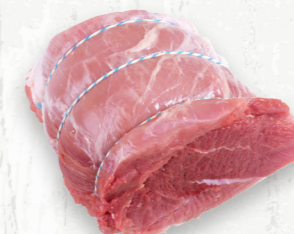
Épaule de porc picnic, le rôti coussin

Avec ou sans os, le rôti de palette est parfait pour la cuisson au four ou le pot-au-feu, en braisé ou fumé pour le barbecue et le porc effiloché. La palette offre une viande à la texture ferme et bien persillée de saveur prononcée pour des résultats juteux.