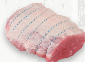
Rôti désossé d'extérieur de fesse

Le centre est le muscle sous-primaire de la fesse, ce qui en fait un excellent choix pour des plus petits rôtis pour une ou deux personnes. Le centre est souvent la partie la plus persillée de la fesse, le rendant tendre et juteux lorsque cuit correctement.