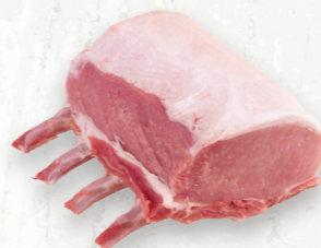
Rôti de côtes de porc, le carré

Le rôti au four « côte de choix » de qualité supérieure est bien persillé, finement texturé et offre une saveur prononcée.