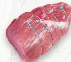
Rôti d'intérieur de fesse, désossé

Le carré de côtes de style hôtel est un rôti de choix pour le four, disponible en plusieurs tailles et parfait pour les occasions spéciales. La partie du bout des côtes est bien persillée pour un résultat tendre et juteux.