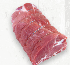
Palette de porc désossée, rôti capicollo

Les rôtis doubles de longe désossée de porc sont des rôtis maigres au four de qualité supérieure, parfaits pour les grands événements de rôtissage. Les rôtis doubles de longe se prêtent bien à la saumure, à la marinade liquide ou sèche et au glaçage afin de maximiser la saveur, la jutosité et la tendreté.