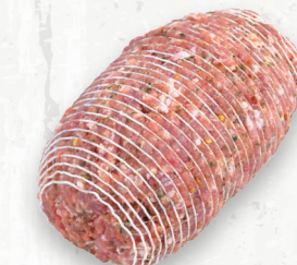
Rôti de porc haché, assaisonné

Le filet est parfait pour un petit rôti et pour être farci. Le filet est naturellement tendre et offre une texture fine et maigre, de saveur délicate et qui se prête bien à la marinade sèche et au glaçage pour bonifier la saveur.