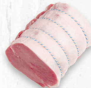
Longe de porc, rôti désossé de centre

Le rôti de pointe de surlonge au four offre une texture ferme, une saveur moyenne et une viande maigre, et est parfait pour les gros rôtis. La pointe se prête bien à la saumure, à la marinade liquide ou sèche et au glaçage afin de bonifier sa saveur, sa jutosité et sa tendreté.