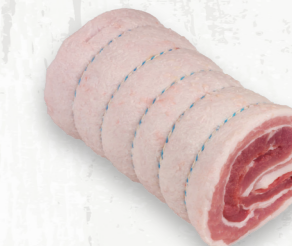
Flanc de porc, rôti de flanc de porc sans couenne

La pancetta, un rôti de flanc avec la couenne, présente une viande bien persillée à saveur délicate, tendre et juteuse, bien équilibrée et avec une peau extérieure croustillante (craquante).