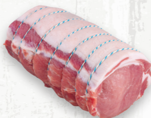
Rôti de côtes de porc désossé

Méthodes de cuisson Pot-au-feu Rôtissage au four Barbecue